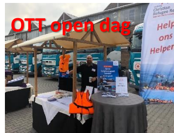
OTT open dag